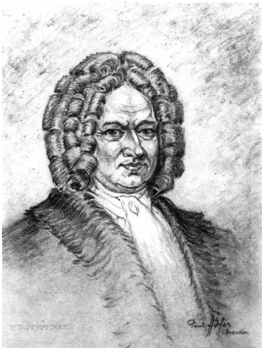
Matthäus Daniel Pöppelmann